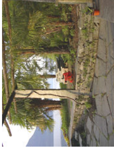
Pergola und Garten