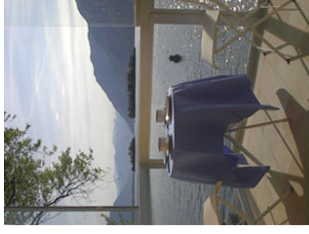
Aussicht auf die Isole di Brissago