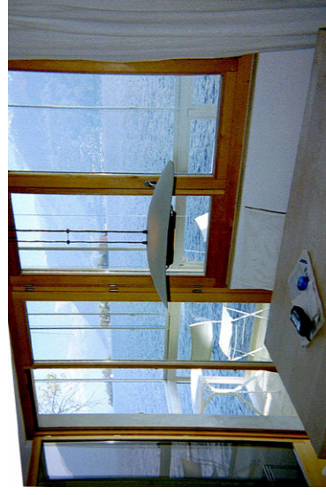
Essecke mit Seesicht

Das Ferienhaus ist für 4--5 Personen ausgelegt und liegt je 1km zwischen Ronco und Brissago, nahe der schweizerisch-italienischen Grenze. Zur Badezeit für Familien mit Kindern besonders geeignet.